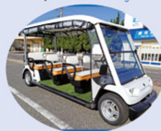
ヤマハ「ランドカー」