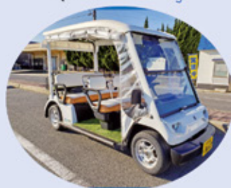
ヤマハ「ランドカー」

6歳未満のお子様はご乗車になれません。 (後部座席チャイルドシート不可のため) ドア付きですが窓がございません。