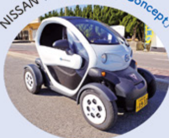
NISSAN「New Mobility Concept」